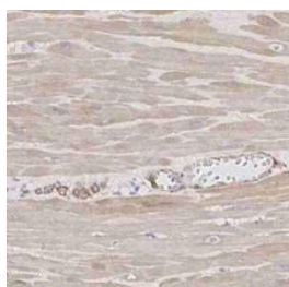
\alpha -SMA イヌ 平滑筋