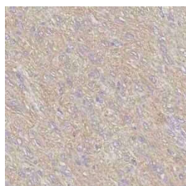
c-kit イヌ GIST